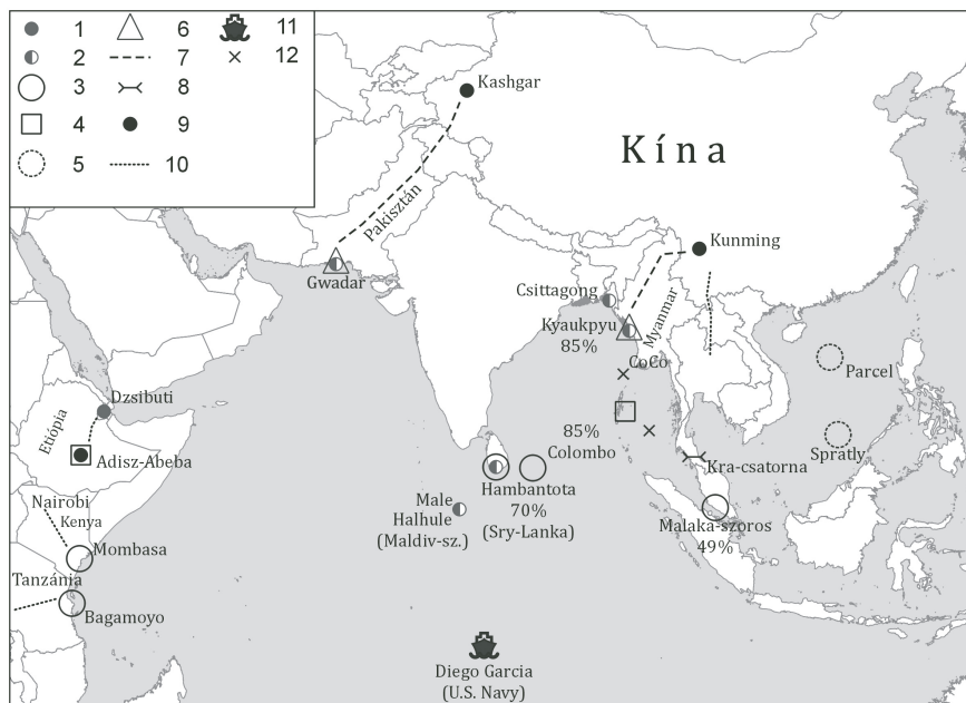
1. ábra: Kína gazdasági-katonai pozícióinak erősödése az Indiai-óceán tágabb térségében China's strengthening economic and military positions in the wider Indian Ocean region

Jelmagyarázat: 1 - kínai haditámaszpont, 2 - a kínai hadihajókat rendszeresen kiszolgáló kikötők, 3 - Kína által hosszú időre bérelt és olyan kikötő, melynek üzemeltető társágában kínai állami cégek többségi tulajdonosok (%), 4 - indiai flottatámaszpont, 5 - (Vietnám, Fülöp-szigetek és Malajzia által) vitatott hovatartozású, Kína által megszállt szigetcsoportok, 6 - kínai többségű tulajdonban lévő gateway kikötők, korridorok kiindulópontjai, 7 - kikötőkből Kínába vezető közlekedési/energia korridorok, 8 - a Malaka-szoros tervezett hajózácsatorna alternatívája, 9 - nemzetközi korridorok kínai végpontjai, 10 - Kínát Laoszon, Thaiföldön és Malajzián keresztül Szingapúrral összekötő vasút elkészült szakasza, 11 - USA haditámaszpont, 12 - a kínai tengeri geopolitikai/katonai stratégia számára potenciális jelentőségű szigetek.