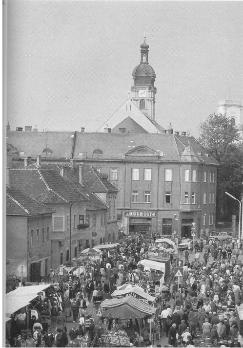
2. ábra: A Dunakapu téri piac a rendszerváltás környékén Open-air market in Dunakapu square in the late 1980s