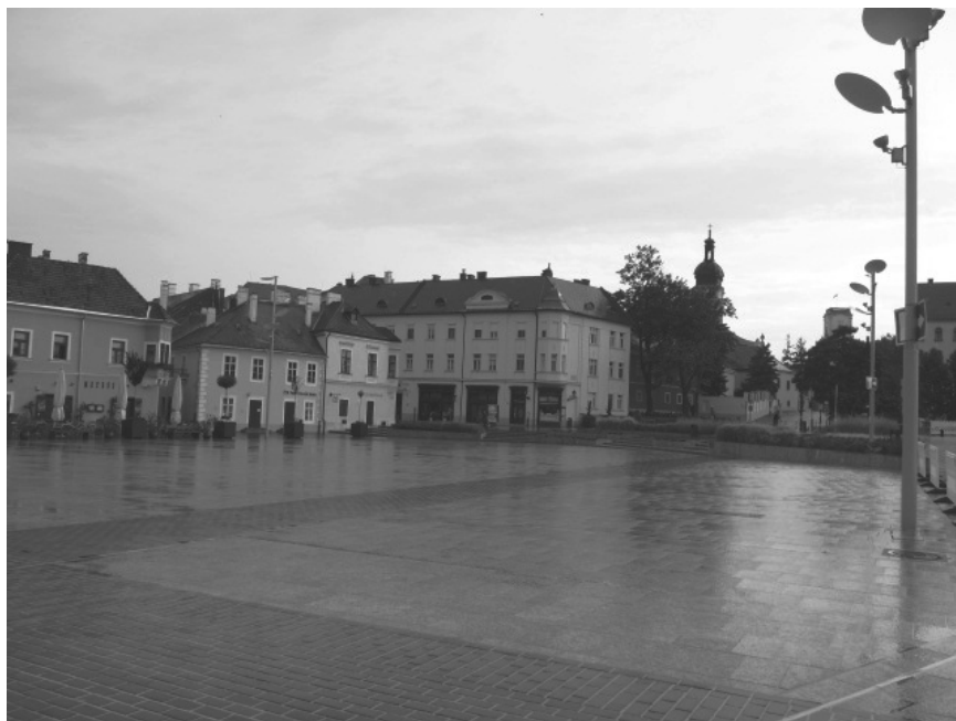
3. ábra: A Dunakapu tér az átalakítást követően Dunakapu square after the urban rehabilitation project