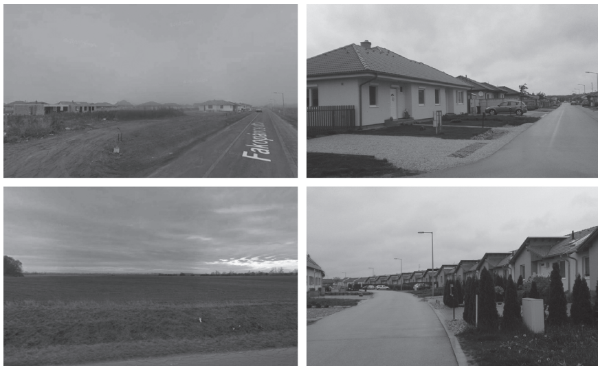
3. ábra: A Fakopáncs és a Pisztráng utca (2011. december és 2017. április) Fakopáncs Street and Pisztráng Street (December 2011 and April 2017)