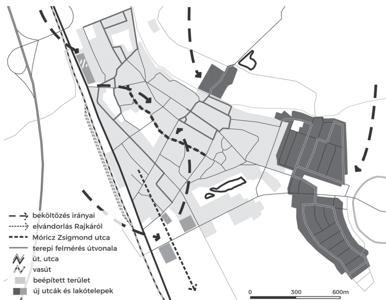
2. ábra: Migrációs és etnikai folyamatok, illetve a terepbejárás útvonalai Rajkán Migration and ethnic processes in Rajka, and the route of fieldwork