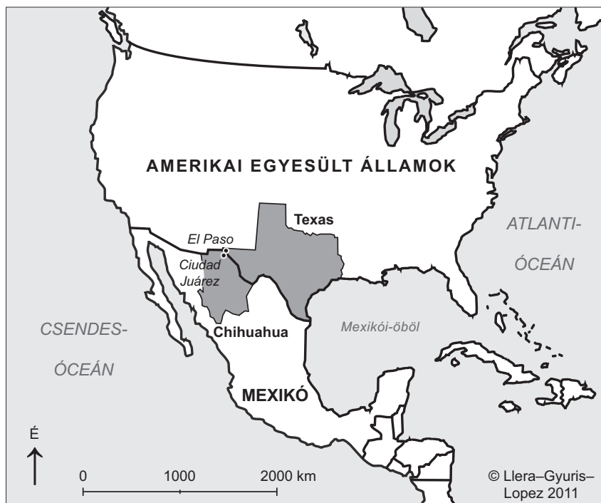
1. ábra: Az El Paso – Ciudad Juárez városrégió földrajzi elhelyezkedése

A történelmi események által két különböző ország fennhatósága alá sodort városok fejlődési pályája az elmúlt bő másfél évszázadban markánsan eltérő módon alakult. Ez egyfelől látványosan megmutatkozik a lakosság anyagi életszínvonalának eltéréseiben: míg a jelenleg 763 000 lelket számláló El Paso (REDCo 2011) egy főre jutó GDP-je 2009-ben meghaladta a 34 200 dollárt (BEA 2011, DSHS 2011), addig a mexikói Chihuahua szövetségi állam